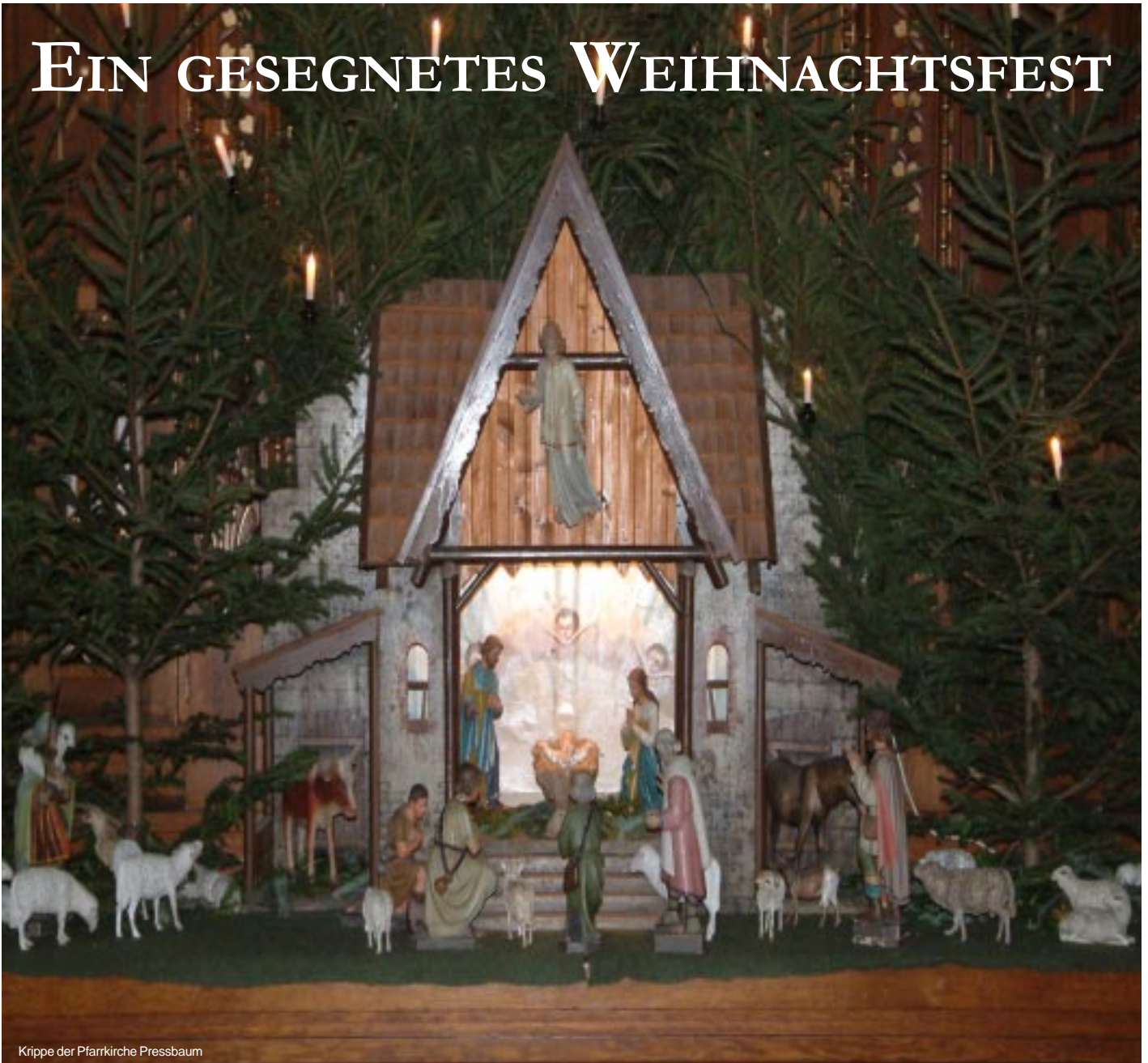
Krippe der Pfarrkirche Pressbaum

und ein ERFOLGREICHES JAHR 2005 wünschen DIE FREIHEITLICHEN PRESSBAUMS