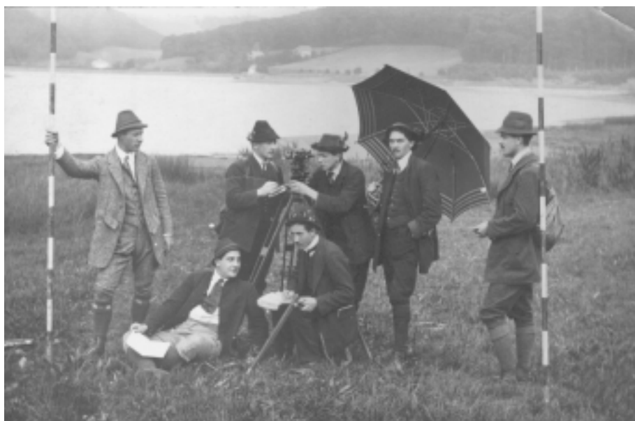
Vermessungstätigkeiten beim Wienerwaldsee am Beginn des 20. Jahrhunderts