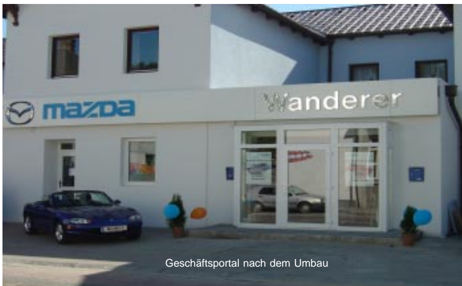
Geschäftsportal nach dem Umbau