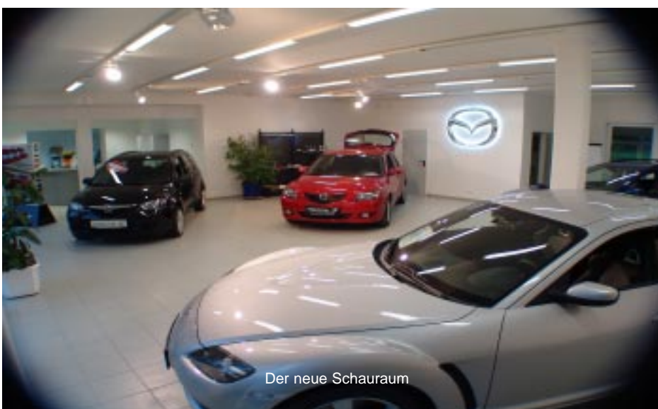
Der neue Schauraum

Wollen Sie einen Mazda kaufen? Schnell zu Mazda Wanderer laufen.