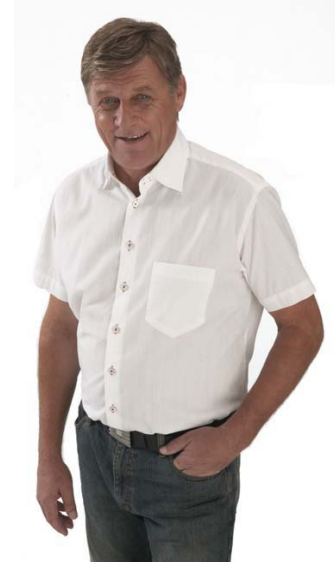
NAbg. Bernhard Themessl, Wirtschaftssprecher der FPÖ

Im Kapitel „Beschäftigung steigern“ zeigt das Impulsprogramm konkrete Maßnahmen auf, um Lohnnebenkosten zu senken. So gibt es z.B. beim IESG-Fond oder bei der AUVA konkrete Einsparungsmöglichkeiten.