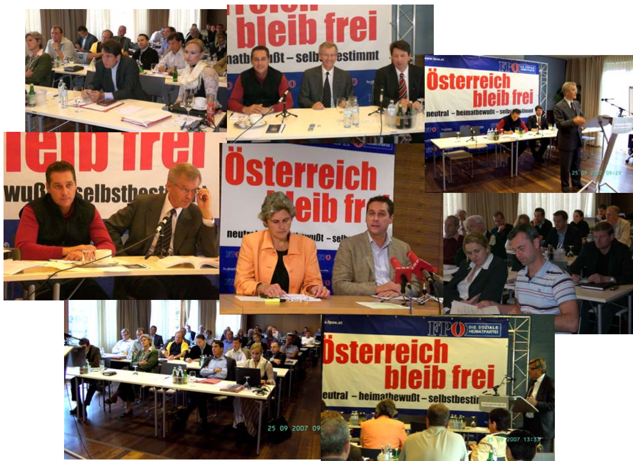
Eindrücke von der Klubklausur in Stegersbach